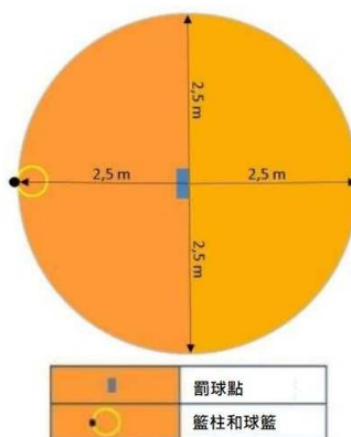
圖 3 - 自由傳球區域